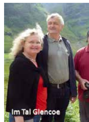
Im Tal Glencoe