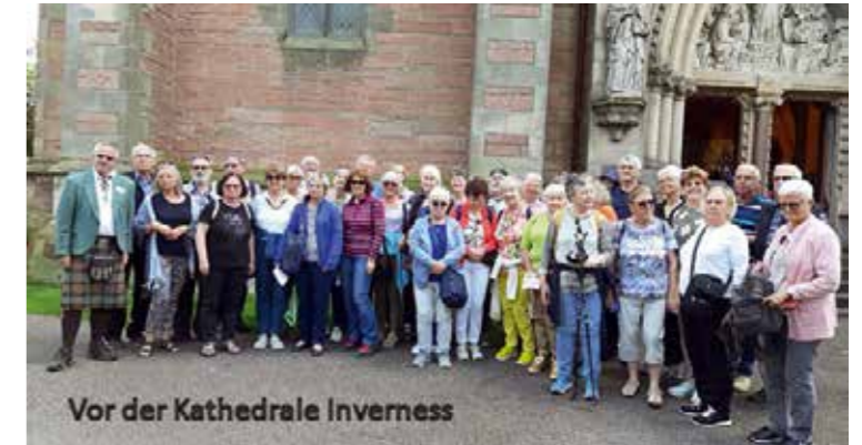
Vor der Kathedrale Inverness

Bericht von Helmut Kumpfmüller, BSI i.R.